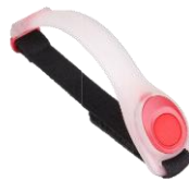
Reflectie armbandjes (per paar 5€)