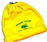
Muts : 7€

Heb je ondertussen een maatje meer of minder, vergeet dan niet jouw gewijzigde kledijmaat te melden aan roland.outtier@gmail.com .